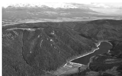
Prečerpávacía vodná elektrárne Čierny Váh

Vodné elektrárne plnia tieto služby najoperatívnejšie zo všetkých zdrojov a zároveň s najmenším nepriaznivým vplyvom na životné prostredie. Prečerpávacie vodné elektrárne - Čierny Váh, Liptovská Mara, Dobšiná, svojou funkciou dokážu z väčšej časti eliminovať aj ten nepriaznivý faktor elektrickej energie, ktorým je jej problematické skladovanie, pretože spotreba a výroba musí byť v každom okamihu v rovnováhe. Tieto vodné elektrárne nielen dokážu dodávať elektrickú energiu v čase jej špičkovej spotreby, ale v prípade prebytku ju dokážu zo sústavy aj odčerpať a v podobe potenciálnej energie vody prečerpanej do hornej nádrže elektrárne ju tam uskladniť, a tým pripraviť na použitie v čase, keď je energie nedostatok.