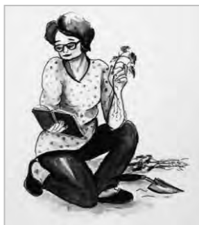
Mám 70 a som prváčka

Vykapalo toho mnoho. Pokus – omyl, je drahá technika. Dospela som do štádia, keď už niečo o rastlinách, stromoch, pôde, záhradnej architektúre mám prečítané, naštudované. Teda viem, že budem pestovať len to, čo moje drakonické postupy prežilo a odolalo mojim zásahom v záhrade. Milujem tie moje záhrady. Už síce tolko nevládzem dvíhať celé vrecia hlíny, kôry, sadiť väčšie stromy či presádzať kríky. Bolí chrbát, ruky, nohy. Nikdy ma však v záhrade nebolí hlava. Občas srdce, keď niečo neprežije alebo mi krtko vyhrabe zdravú rastlinu. To však rýchlo prejde. Záhrada je môj terapeut, moja láska, moja pýcha.