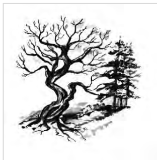
Vstúp do chrámu

Vždy keď vojdem do lesa, ovládne ma zvláštny pocit. Nevieť ho opísať. Vždy na mňa dýchne jeho neopísateľná atmosféra. Je tam božský pokoj, rovnováha, rôzne vône, ticho prerušované spevom vtáčikov a šumom vetra v korunách stromov. To všetko splýva do jednej neuveriteľne krásnej symfónie farieb, zvukov, vôní, v ktorej je každá sekunda originálna a neopakovateľná. Najlepšie sa táto atmosféra vníma, keď človek zatvorí oči a naplno otvorí všetky ostatné zmysly.