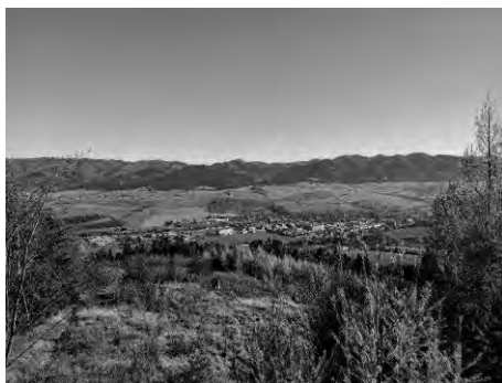
Pohľad na Rajeckú dolinu

dokazuje, že turisti na chodníku rešpektujú prírodu a drobnosť v podobe smetného koša posunula naše myslenie. Je pozitívne zistiť, že takouto inverziou myslenia je možné nabudiť ľudí k tomu, aby rešpektovali svoje okolie a prispeli tak k čistejšiemu prostrediu. Smetný kôš bol naplnený zhruba do polovice objemu, pričom sme sa spoločne zhodli, že aj my prispějeme k ekológii. Čiastočne sme vytriedili celý jeho obsah a pripravili na znesenie dolu po ceste späť. Po krátkom odpočinku a nabažení sa pohľadov do okolia pokračujeme k vrcholu Dubová. Naša cesta sa