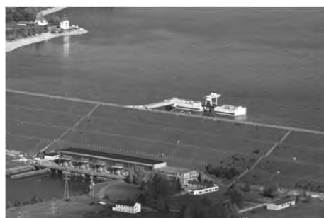
Prečerpávacía vodná elektrárne

Vážska kaskáda pozostáva z vodných elektrární: Čierny Váh, Liptovská Mara, Bešeňová, Orava, Tvrdošín, Krpeľany, Sučany, Lipovec, Žilina, Hričov, Mikšová, Považská Bystrica, Nosice, Ladce, Ilava, Dubnica, Trenčín, Kostolná, Nové Mesto nad Váhom, Horná Streda, Madunice, Kráľová. Sú vybudované na derivačných kanáloch. Pôvodné koryto Váhu