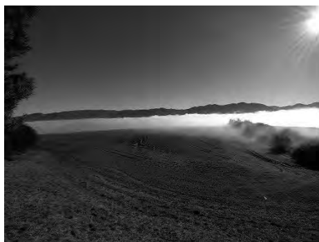
Pohľad na Rajec pod zalesnenou časťou Dubová

Pre pohľad na Rajec si ďalšia dnešná inverzia prizvala práve nás, divákov tejto nádhery. Bola to taká malá odmena za prekonanie prvého prevýšenia. I keď bolo mesto, ako aj samotná dolina zakrytá hmlou, tá pomyslene pokrývala aj mnohé z tajomstiev histórie jej obyvateľov. Práve o tom je obsah náučného chodníka, ktorý poukazuje nielen na ňu, ale aj na osobitosti fauny, flóry a zaujímavosti regiónu.