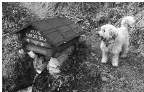
Prameň Slnčné skaly

Začal som si viac všímať neporiadok v prírode. Prechádzky s mojimi psami som obohatil o čistenie prírody. S nadšením som nad vyvierajúcim prameňom vody dal zhotoviť prístrešok a pravidelne som sa staral o čistotu tohto prameňa. Neostal som len pri tejto aktivite. Každý rok som s priateľmi zorganizoval spoločné čistenie prírody, turistického a náučného chodníka Slnčné skaly. Teší ma, že aj po rokoch je prístrešok nad prameňom funkčný. Na svojich prechádzkach vždy rád zájdem ku studničke, osviežim sa jej sviežou vodou a naberiem si z nej aj do fliaš. A tak mám doma vždy k dispozícii tento jednoduchý a zdravý nápoj. V súčasnosti som zmenil revír, do ktorého chodím „venčiť“ svojich psov. Dal som si záväzok, že aj tomuto kúsku prírody pomôžem a zbavím ho neporiadku. Po každej prechádzke odchádzam z lesa nielen naplnený pozitívnou energiou, ale aj s taškou vlastnoručne nazbieraných odpadkov. Vnútorne cítim radosť pri pohľade na krásnu a čistú prírodu, ku ktorej som aj ja, svojím dielom, prispel.