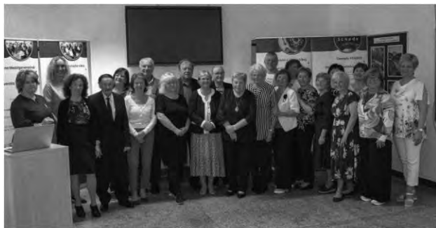
Dobrodeň, ocenení dobrovoľníci U3V

V rámci týždňa osláv bol jeden DOBROdeň venovaný aj poďakovaniu našim dobrovoľníkom vo vzdelávaní. Ocenených bolo 22 aktívnych dlho-