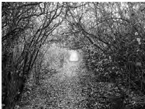
Pohľad na chodník smerom k Rajcu

spojenú s odborným komentárom obsahu chodníka. Októbrové počasie nám viackrát neprialo, a tak sme boli donútení uspokojiť sa len s teoretickým výkladom histórie výstavby chodníka a jeho virtuálnou