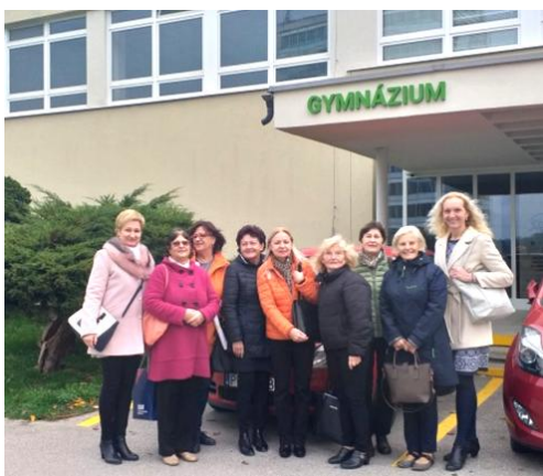
Workshop osobnosti prírodných vied

„Mala som z akcie veľmi dobrý pocit, myslím, že splnila účel. Študenti sa mi javili aktívni a spôsobilí, akým sme pracovali, ich motivoval. Myslím tým použité metódy: kooperatívne učenie, projektové učenie, pojmová mapa, využitie dramatických prvkov...“